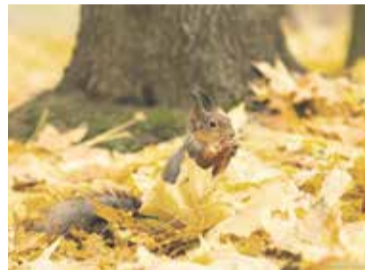
вздымая волны вокруг себя, тоже «здорово».

грибки. Их задача — переработать уже ненужные элементы растений. Можно хорошенько повалиться в опавших листьях, чтобы инфекция попала на слизистые и незащищённые участки тела, где точно имеются микротравмы, но это экстрим. Достаточно будет пару раз подбросить охапки осеннего золота, чтобы мельчайшие частицы поднялись в воздух и попали в организм. Побродить по шуршащему ковру,