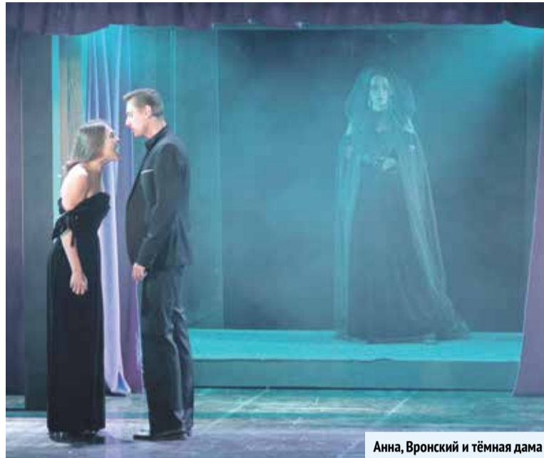
Анна, Вронский и тёмная дама