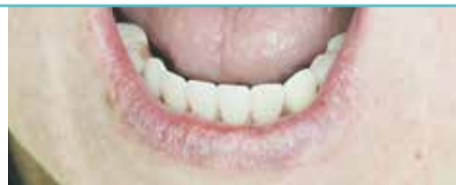
Новый протез, установленный в день операции. Авторство — врач-стоматолог, хирург Дмитрий Александрович Никонов

КАК ЭТО РАБОТАЕТ. Этот метод основывается на установке четырёх имплантов, два из которых располагаются в передней части и два — в боковых отделах челюсти, что обеспечивает одновременно надёжную фиксацию протеза и равномерное распределение нагрузки. После вживления имплантов по индивидуальному слепку изготавливается специальный протез, основа которого — титановый каркас.