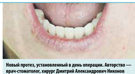
Новый протез, установленный в день операции. Авторство — врач-стоматолог, хирург Дмитрий Александрович Никонов

КАК ЭТО РАБОТАЕТ. Этот метод основывается на установке четырёх имплантов, два из которых располагаются в передней части и два — в боковых отделах челюсти, что