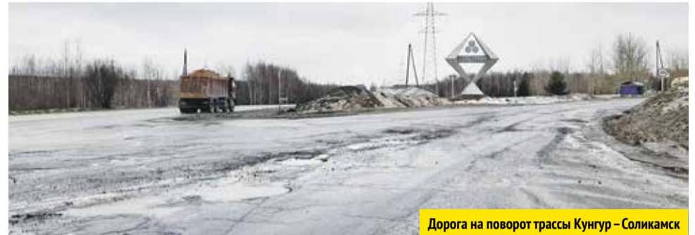
Дорога на поворот трассы Кунгур – Соликамск

Каждую весну вместе со снегом чудесным образом на березниковских городских дорогах «тает» асфальт. На этой неделе представители местных СМИ сами это зафиксировали, совершив рейд по наиболее проблемным участкам дорог вместе с представителями городской администрации.