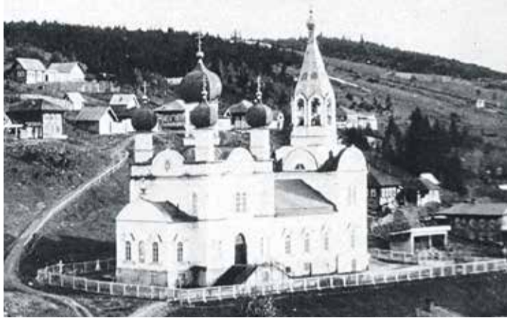
Свято-Троицкий храм в былые времена

из совместной отливки с одной из блях, найденных в Кыне. Это даёт основание предполагать, что данные амулеты изготовили для двух братьев-воинов и охотников. Один остался на своей родине, другой мигрировал за сотни километров — в Полярный Урал.