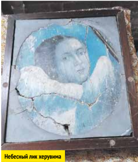
Небесный лик херувима

Подлинным украшением посёлка является Свято-Троицкий храм, возводившийся на деньги Строгановых в течение 14 лет — с 1850 по 1864 год. Он построен в старомосковском шатровом стиле.