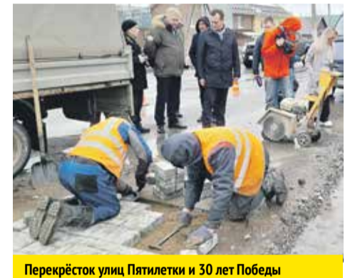
Перекрёсток улиц Пятилетки и 30 лет Победы

Кстати, в этом году должна быть капитально доделана и сдана в эксплуатацию транспортная артерия города придётся довольствоваться лишь ямочным ремонтом для снятия аварийной напряжённости. В 2022 году тоже не было выполнено ни одного более качественного и долговечно-го текущего ремонта дорожного полотна.