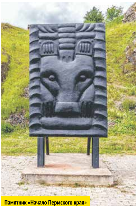
Памятник «Начало Пермского края»

В честь этого археологического события у подножия горы Плакун на левом берегу речки Кын установили памятник «Начало Пермского края» в виде увеличенной копии знаменитой бронзовой бляхи. Говорят, если потереть лапы медведю, к тебе переходит его сила и смелость. Примечательно, что у изображённого в жертвенной позе медведя на передних лапах по четыре пальца. Убив зверя, охотники специально потом отрубали ему большие пальцы и устраивали почётные поминки. Только так, по поверьям угров, медведь превращался в духа и помощника. А иначе мог воскреснуть и навредить человеку.