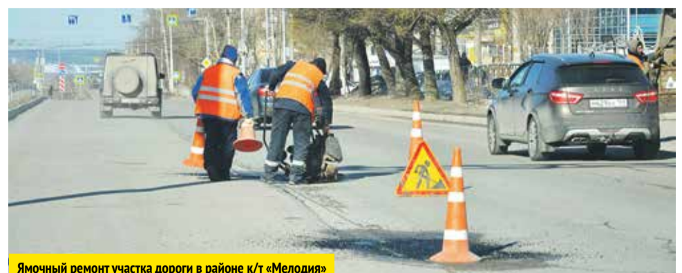
Ямочный ремонт участка дороги в районе к/т «Мелодия»

Знаем, что ям на дорогах много. Работы ведём постепенно», — сообщается в официальном паблике ВК «Благоустройство города Березники» ( vk.com/blagoustroistvovrz ).