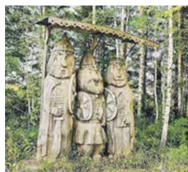
Пример оформления тематических полян

Мы будем следить за развитием этого объекта и приглашаем вас делать это вместе с нами.